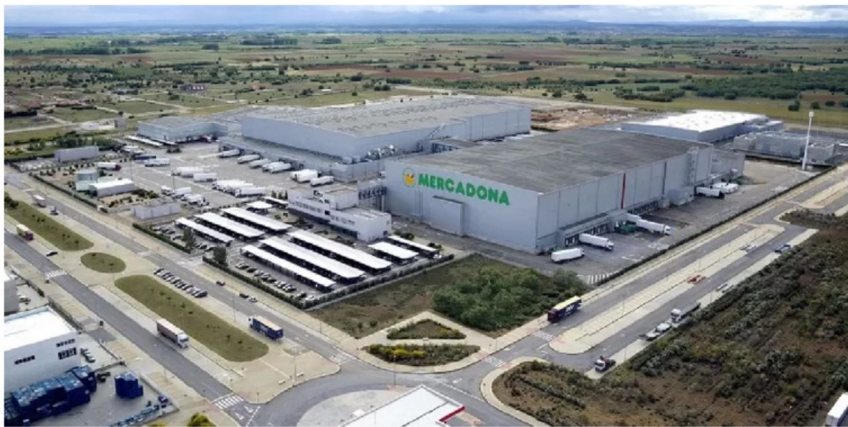
Polígono industrial de Villadangos