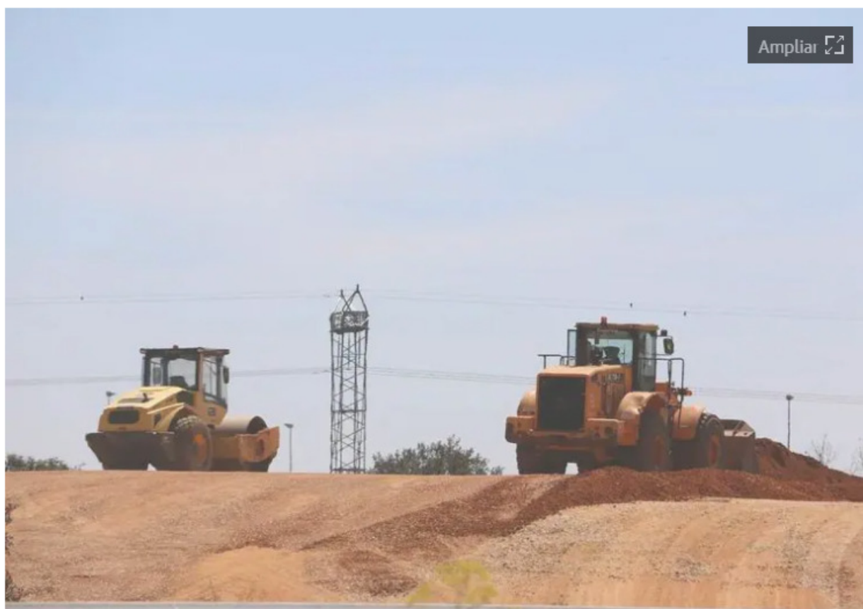
Obras para introducir el ramal ferroviario en el polígono. S.S.

Las 186 hectáreas adquiridas para la ampliación ya tienen peticiones de empresas para instalarse ocupando la mitad del nuevo suelo industrial | La urbanización de las parcelas estará lista en menos de dos años